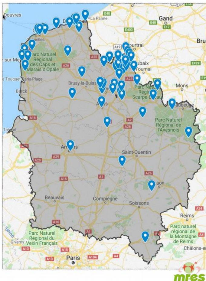
Carte des Repair Cafés HdF au 10/07/19

AXE 4 Se connaître, mettre en place une gouvernance partagée